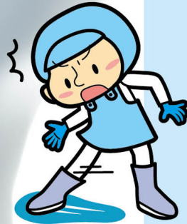
横滑りが 心配な職場に