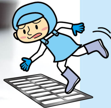
グレーチングで 滑りやすい職場に