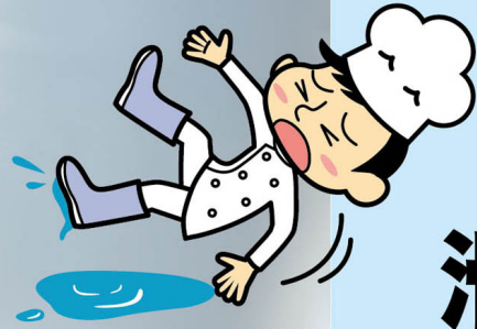
水・油で 滑りやすい職場に