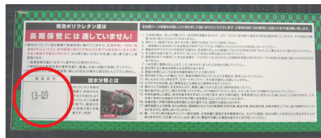
[写真上] 箱側面に見やすいように大きく表示し、併せて注意書き用紙も同梱いたします。[写真右] また、製造年月も表示いたします。(写真○印部、2013年9月製造の例)

弊社ではポリウレタン製品の劣化現象であります「加水分解」に関する認知を広めるよう、今まで発泡ポリウレタン底製品の箱内面に表示していた注意事項を 外面に大きく表示 、さらに 製造年月も追記 、併せて 注意書き用紙も同封 するよう順次仕様変更しております。